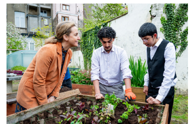
Le Jardin des Délices, Laeken