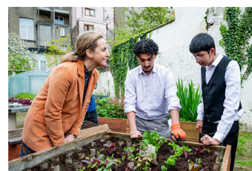
Le Jardin des Délices, Laeken